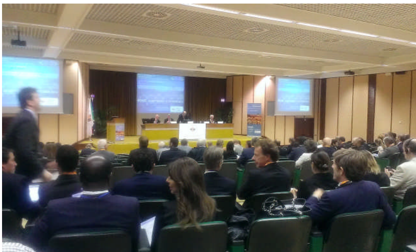
主要會場(當時為開幕式)