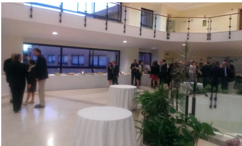
歡迎酒會會場--羅馬歐洲大學三樓中庭