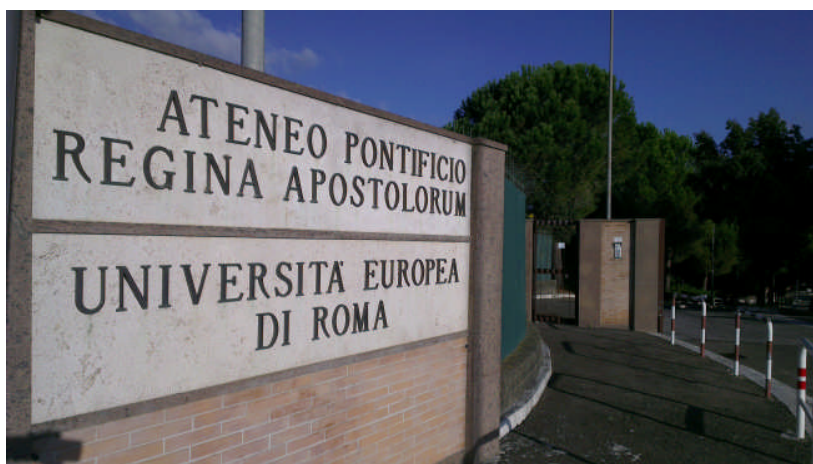
會場--羅馬歐洲大學(UNIVERSITA EUROPEA DI ROMA)大門