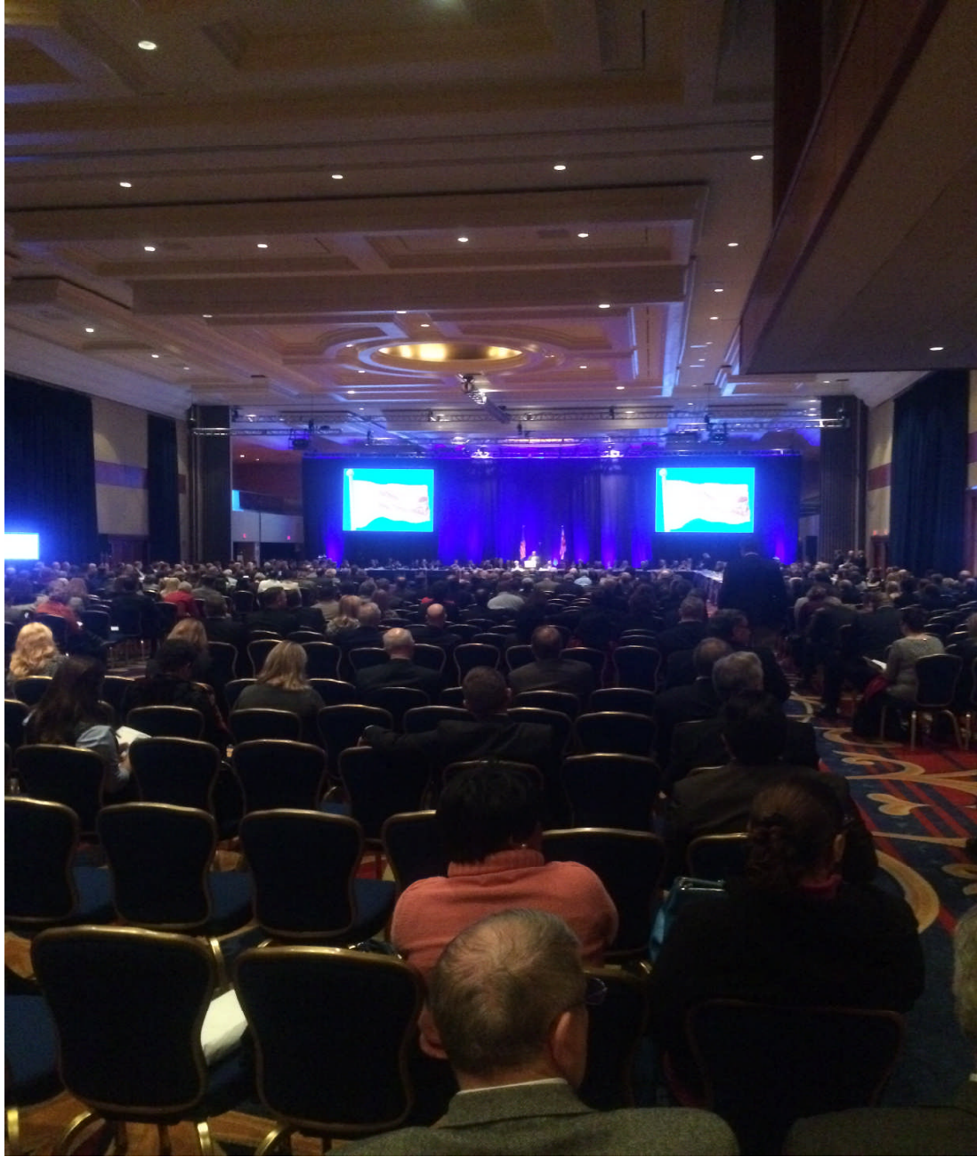
圖 1：103 年 11 月 16 日開幕式會議情形